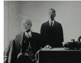
本校校長室において 新渡戸稲造氏(左)