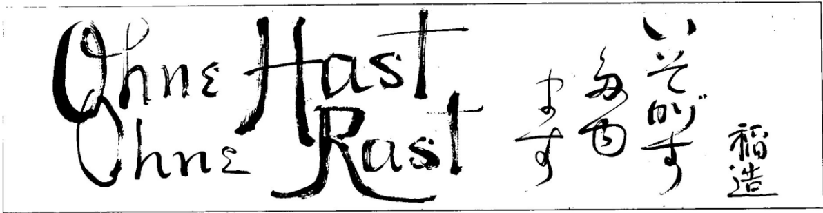
新渡戸稲造書 (今治南高校蔵)